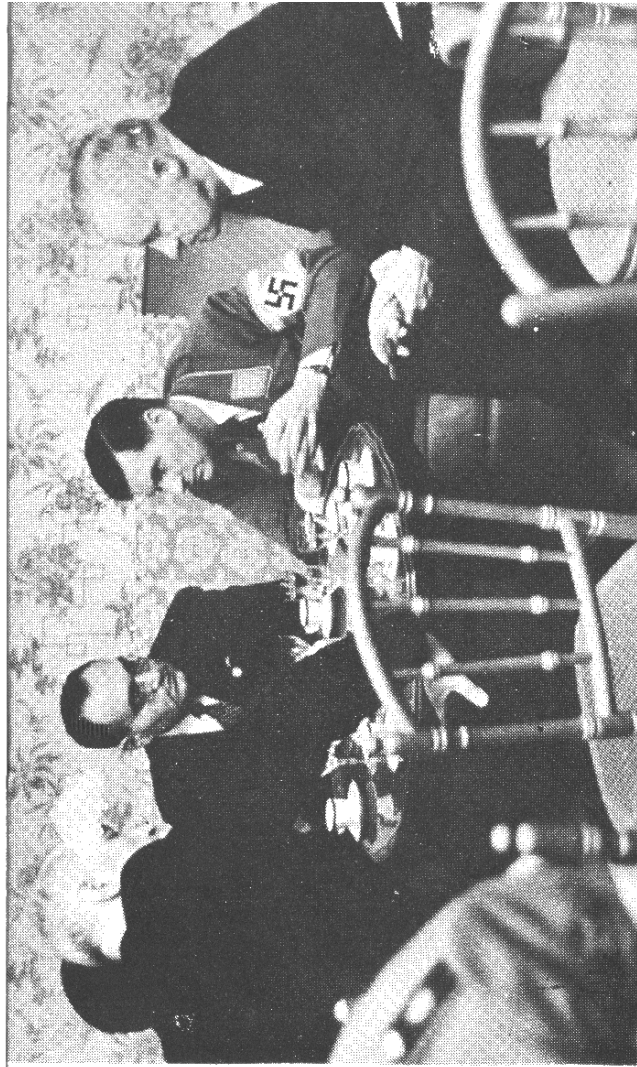
SDP:n puheenjohtaja Tanner Wienissä 1941. Hänen vieressään Hitler-Jugendin johtaja Baldur Schirach. Sodan jälkeen Schirach sai 20 vuotta vankeutta Nürnbergissä — Tanner selvisi 3 1/2 vuodella vankeutta Suomen sotasyllisoikeudenkäynnissä.